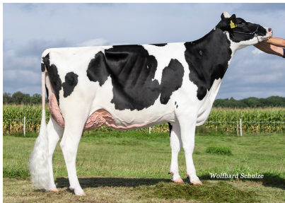
T: Weida GP-84 1La

pp | ET | \beta -Kn A2/A2 | K-Kn AB | aAa 324